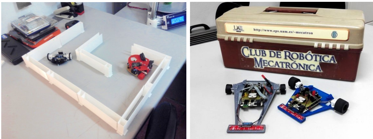
Robots para resolver laberintos (izq) y robots velocistas (der). Las paredes del laberinto que usamos para las pruebas están fabricadas con la impresora 3D.

Desde la última OSHWDem, en el club de robótica hemos avanzado mucho en la construcción de dos robots para participar en la categoría de Laberinto . También llevaremos dos robots para la competición de Velocistas , y si nos da tiempo, haremos algún robot reciclado para la categoría de Combate o HEBOCON .